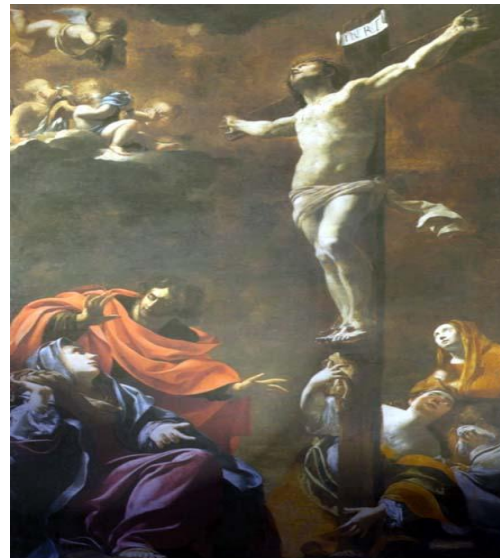
Simon Vouet, Crocifissione, 1622 circa

Dio, Padre misericordioso, tu ci doni la certezza che nei fedeli defunti si compie il mistero di tuo Figlio morto e risorto; per questa fede che noi professiamo concedi al nostro fratello (sorella) che si è addormentato (addormentata) in Cristo di risvegliarsi con lui nella gioia della resurrezione. Per Cristo nostro Signore.