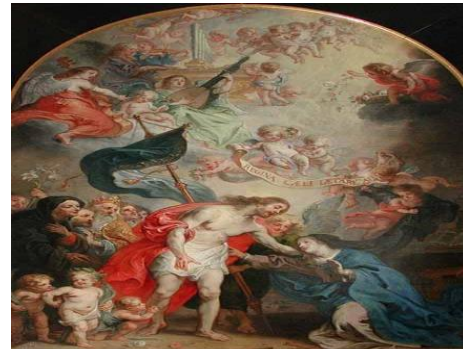
Theodoor Van Thulden, Cristo risorto appare a sua madre, Louvre, Parigi

Accogli, o Padre di misericordia, il tuo fedele (la tua fedele) che non è più visibilmente tra noi; egli (ella) che ha ascoltato con cuore vigile la chiamata del Salvatore, possa entrare preparato (preparata) all'eterno convito di Cristo, tuo Figlio, nostro Signore e nostro Dio che vive e regna nei secoli dei secoli.