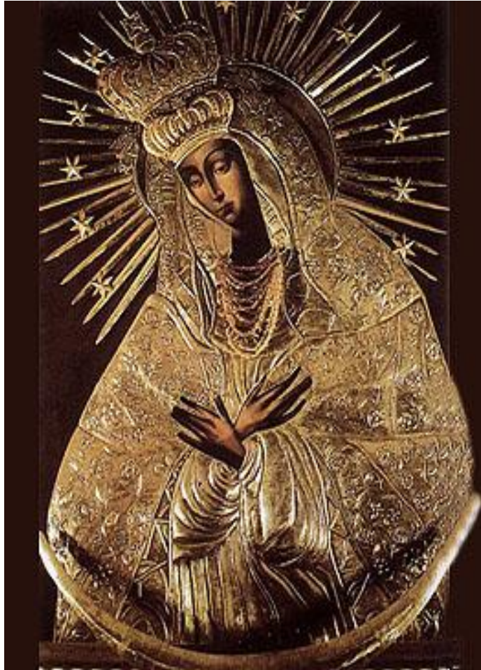
María Madre della Misericordia Lituania - Vilnius (Copia uguale in Vaticano)