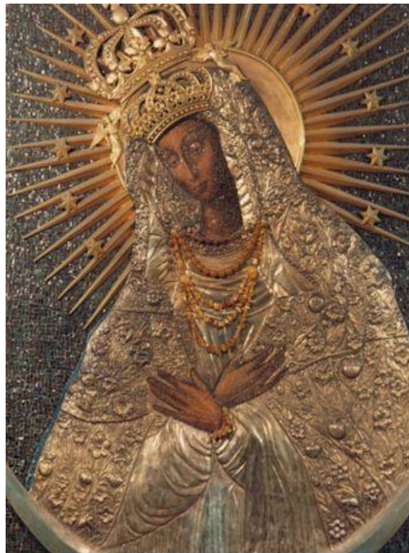
Città del Vaticano-Grotte-Cappella della Madonna della Misericordia di Vilnius-La Madre della Misericordia